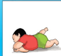
3 Lấy hoặc nghiêng người.