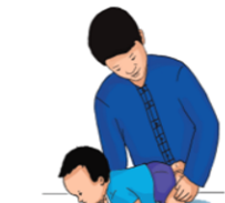
2 Đặt trẻ nằm sấp, đỡ đầu.