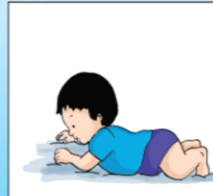
1 Ngọc đầu khi nằm sấp.