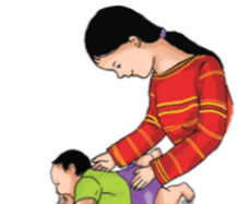
4 Đỡ vai và móng giúp trẻ lật.

Chăm sóc và phát triển trẻ thơ từ 0-8 tuổi (Tài liệu dành cho cha mẹ)